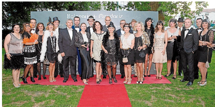
ASISTENTES a la última fiesta celebrada en Mondariz con temática charleston

dispuestas a pasar una noche empapada en moda vintage y charleston. La jornada arrancará con un cóctel en los jardines del edificio Palacios, al que seguirá una cena en su salón principal y la posterior fiesta con música elegida para la ocasión. Si quieren más información, llamen ya mismo al 986656156. Una advertencia: ni se les ocurra ir vestidos de raperos o similar... y el reguetón, por supuesto, queda totalmente prohibido.