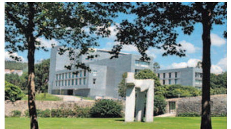
El hotel NH era el quinto hotel de 5 estrellas. P. RODRÍGUEZ