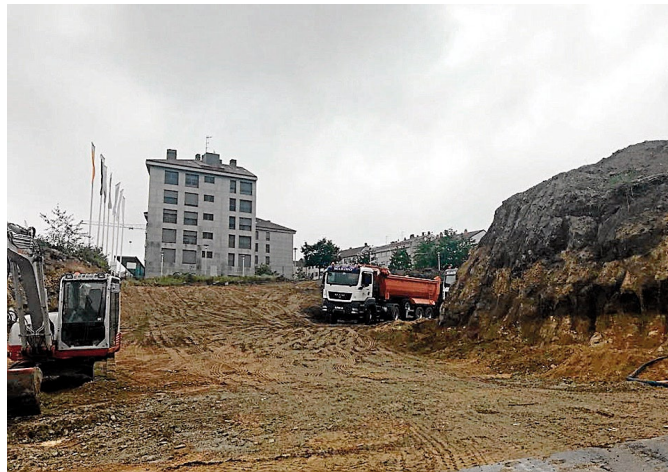
CONSTRUCCIÓN Las obras en el nuevo residencial de Cornes comenzaron hace días.

En cuanto al diseño de los 3.000 m2 de espacios verdes, desde la inmobiliaria señalan que se ha obtenido inspiración en el High Line de Nueva York, combinando diferentes niveles, pasarelas, senderos, espacios