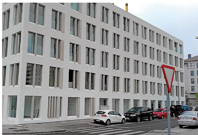
En Santa Marta se entregarán en cuestión de días las 65 viviendas de este bloque.

con vegetación, y mobiliario de descanso. Además, el diseño se realiza con criterios de bajo coste de mantenimiento, "e incorporará riego automático y por goteo e iluminación exterior led para conseguir la mayor eficiencia energética y minimizar los costes comunitario".