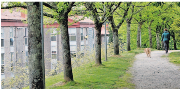
La urbanización se humanizó con la creación de un saludable pulmón verde. S. ALONSO

Vecinos como Pepe o Manolo, que trabajaron duro a través de la asociación Francisco Asorey-Barrio da Almáciga, tanto en la creación de espacios verdes y de ocio para los pequeños y adolescentes que llegaban al barrio como en la urbanización de las calles o en la puesta en marcha de las huertas urbanas. Pepe llegó a principios de los ochenta como beneficiario de una de las viviendas del polígono. «A Almáciga xa daquela era unha zona tranquila, pero estaba estigmatizada pola chegada de familias de raza xitana. A realidade é que a maioría éramos familias normais, como calque-