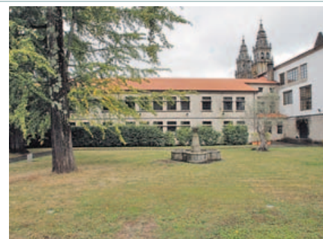
Fonseca se llenará de piedras con textos literarios.

una iniciativa que le rondaba por la cabeza «dende hai dez anos». La actuación consiste en la colocación de piedras de granito con la inscripción de textos de escritores de todo el mundo entre los que se encuentran los gallegos Rosalía de Castro o Luz Pozo Garza, así como otros mundialmente conocidos como el Nobel Seamus Heaney.