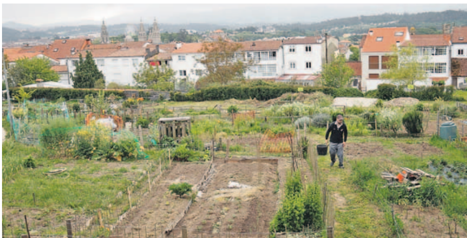
Las huertas urbanas que se cultivan en Almáciga son un mirador único desde el que se otea la ciudad. SANDRA ALONSO

Poco a poco los lugareños se fueron acercando y fueron domesticando el paisaje. Primero plantaron carballos y luego montaron cabañas. Y así hasta que a principios de los ochenta se levantaron las casas sociales que poblaban Vite, San Caetano y la Almáciga de familias de muy diferentes procedencias, razas y culturas que lo único que tenían en común era la modesta situación económica que les daba derecho a la vivienda. Y sobre todo Vite, pero también la Almáciga, se manchó ligeramente de esa mala fama provocada por un reallojo siempre peligroso si no va acompañado de programas de inserción. Pero en la Almáciga se hizo, y lo hicieron sobre todo los vecinos, los menos interesados en que su barrio fuese la Vallecas compostelana ni nada que se le pareciese.