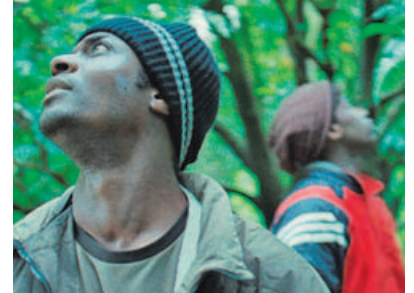
«Mediterránea». La obra de Carpignano sobre la inmigración (finalista Premio LUX) se proyectará simultáneamente en ocho ciudades europeas.