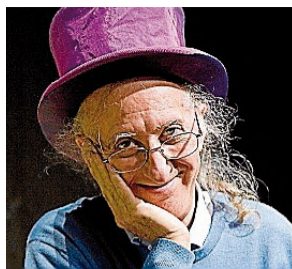
Juan Tamariz Mago