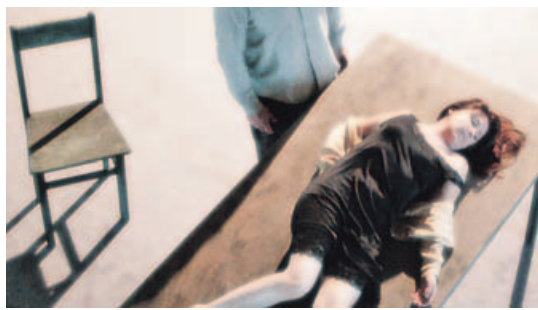
Teatro de Ningueres aborda en su nueva obra la violencia de género.

22 horas. Sa-lón Teatro. Gratis, retirando invitación y hasta agotar el aforo. Teatro de Ningueres protagoniza esta noche el segundo estreno absoluto de Galicia Escena Pro con la representación de su nuevo espectáculo, Unhas poucas picadelas , que aborda en la lacra de la violencia de género a partir de un texto de Laila Ripoll (premio nacional de Literatura Dramática 2015). Además, la feria profesional de las artes escénicas gallegas también contará hoy en el Salón Teatro con la función de Don Quixote, unha comedia gastronómica de Limiar Teatro (10.00); en La Fundación