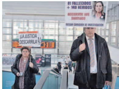
«Frankenstein-04155». El documental de Aitor Rei sobre el descarrilamiento en Angraís recibió una mención especial en la Seminci de Valladolid.