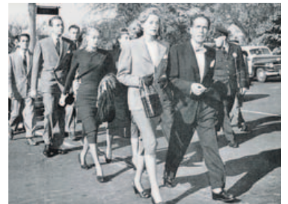
«Roxos e Marcianos». Cineuropa dedicará una amplia retrospectiva a los bandos opuestos del cine durante el período prefascista en la Guerra Fría.

sualización de su último trabajo, La Calle de la Amargura , con el que resurgió este verano en Venecia. Ripstein recibirá el Premio Cineuropa de este año, junto con Miguel Gomes, reco-