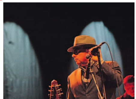
Van Morrison actuó en el Multiusos de Sar. Á. BALLESTEROS