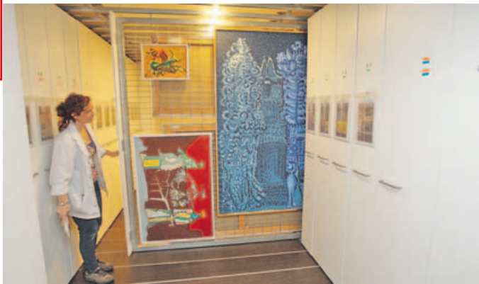
La Fundación Granell muestra sus almacenes y talleres por el Día dos Museos. XOÁN A. SOLER

No solo fueron visitas. El Museo Casa de la Troya programó una ruta por la ciudad de la época de la novela. Además, entre los visitantes que recorrieron sus dependencias se encontraba un mexicano