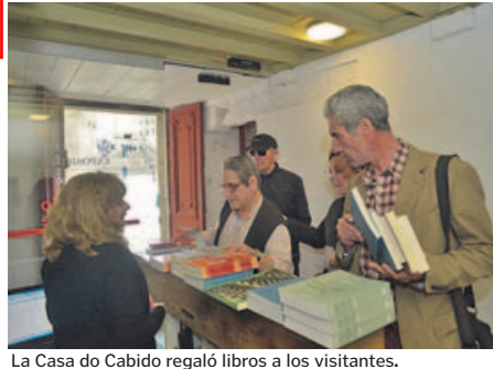
La Casa do Cabido regaló libros a los visitantes.

El Museo inicia hoy su temporada de verano ofreciendo visitas a su interior los viernes y sábados hasta mediados de julio. Además, desde hoy, todos los viernes de mayo y junio habrá visitas culturales teatralizadas por el centro histórico, que terminarán en el museo y partirán a las 20.30 horas de la Praza do