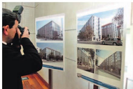
El proyecto incluía la construcción de 171 pisos. S. ALONSO