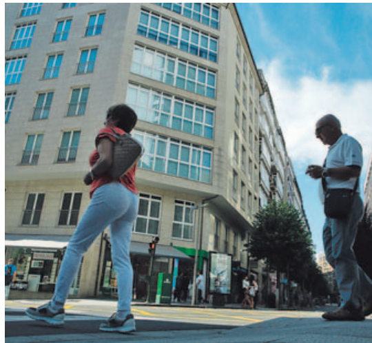
Raxoi puede perder la entreplanta de Xeneral Pardiñas. PACO RODRÍGUEZ

La «gran sorpresa» para los socialistas es comprobar que las alegaciones y el recurso, así como un informe jurídico, «lle foron encargados a un bufete privado, o do señor Trepas», que ya