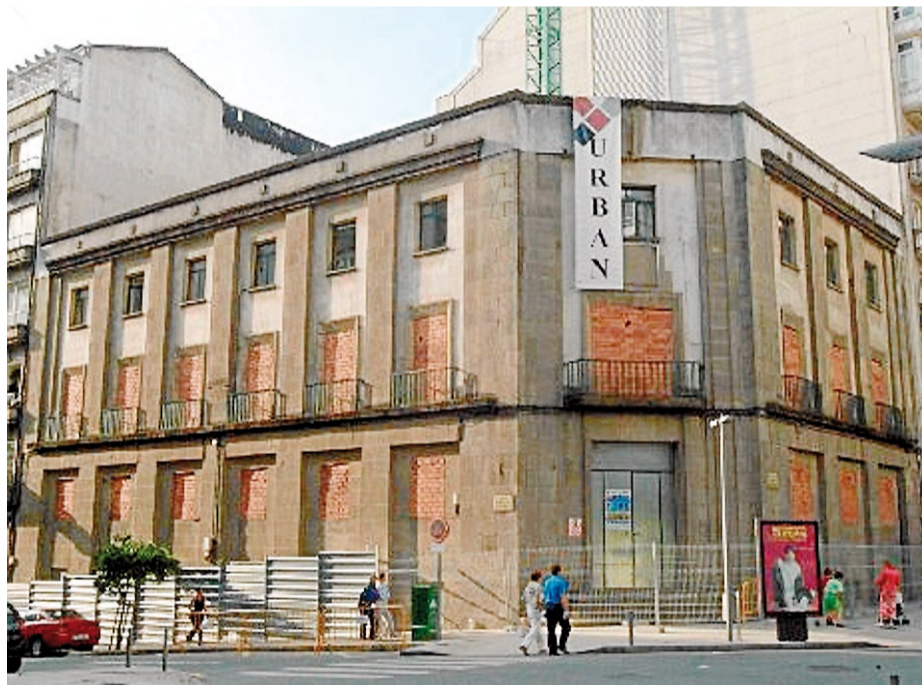
Antigua casa de los sindicatos en la rúa Xeneral Pardiñas.

El edil del PSdeG explicó en una comparecencia ante los medios de comunicación que, después de dos días de búsqueda por el pazo de Raxoi, ayer al fin consiguió acceder a parte del expediente del caso de la propiedad municipal, concretamente a