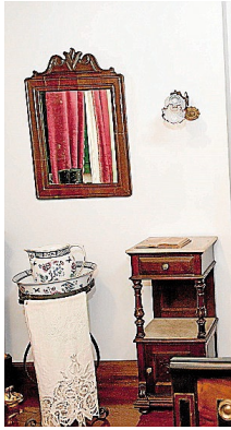
Un rincón do museo