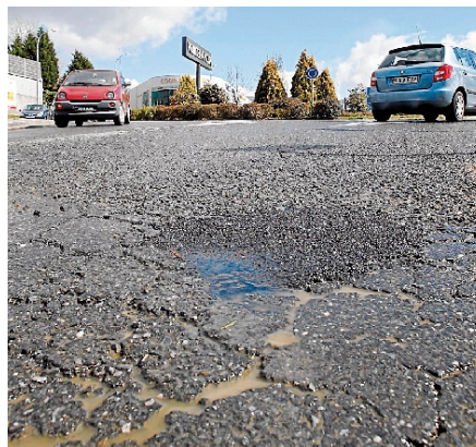
En la jornada de ayer se arregló esta zona de Costa Vella