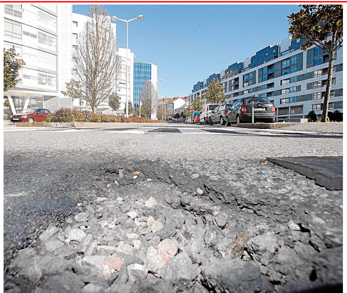
Las fochancas se han instalado también en la avenida de Barcelona.

Asimismo, el plan de obras también afectará a la rúa de Ulpiano Villanueva,