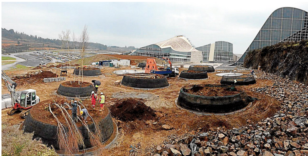
Vista general de las obras del espacio de ocio para niños que se está construyendo en la Cidade da Cultura.

Asimismo, el Bosque de Galicia también estará listo en el transcurso del mes de abril, ya que actualmente se está ultimando la red de sendas y el sistema de iluminación fotovoltaica de bajo consumo del bosque, que acercará el Gaiás al centro de la ciudad.