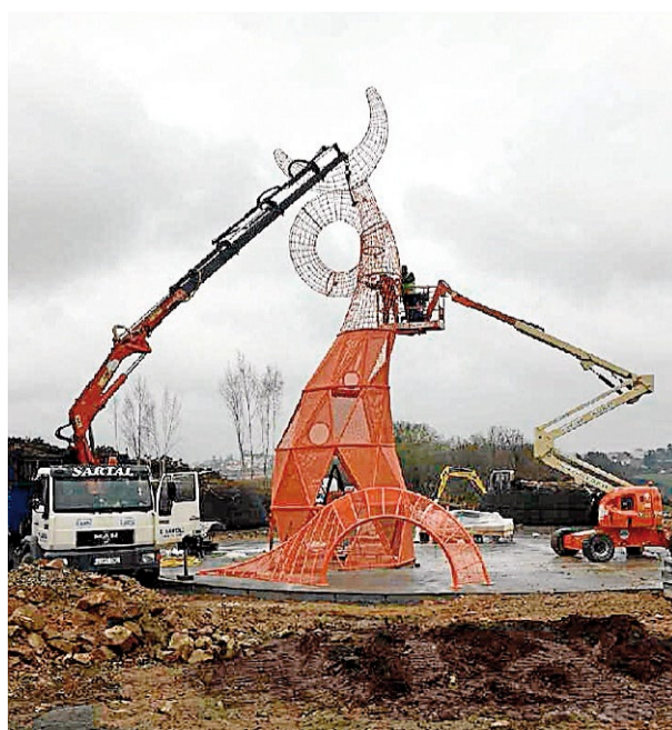
El parque contará con una zona para el descanso.