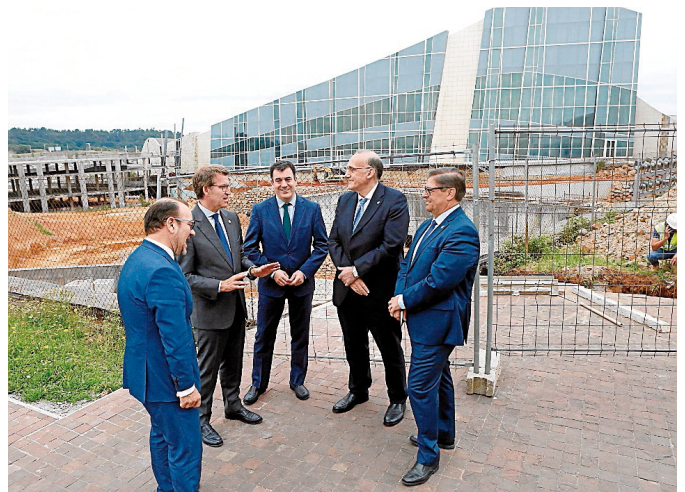
Feijóo, con el conseleiro de Educación y los tres rectores, ayer en el Gaiás.

En segundo lugar, estará el nuevo Consorcio Interuniversitario de Galicia, “que será o centro neuráxico da xestión conxunta das tres universidades”, centralizando los servicios bibliográficos, la organización de las pruebas de acceso a