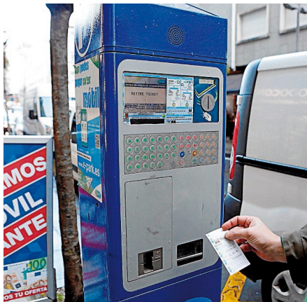
Máquina de la ORA en el Ensanche.

Mientras tanto, CA sigue adelante con su proyecto de remunicipalizar el servicio,