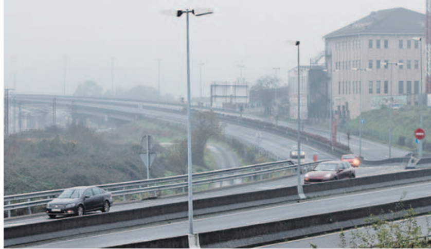
El vial de Santiago de Cuba, que en la foto aparece al fondo del otro periférico, está infrautilizado. S. ALONSO

Es un reto de calado, porque cualquier solución obliga necesariamente a sacar el grueso del tráfico que soporta Clara Campoamor entre el periférico y Pontepedriña, y eso supone habilitar itinerarios alternativos en una red viaria con flujos circulatorios elevados. El planteamiento en el que trabaja el gobierno de Compostela Aberta pasa por canalizar el tráfico de Clara Campoamor por Santiago de Cuba (SC-11), a través del túnel del Hórreo. La idea de partida es que, tanto el vial como el subterráneo, pueden absorber más tránsito del que soportan actualmente. De este modo, se pretende aliviar la carga de la rotonda de Galuresa, que soporta una media de 24.000 vehículos al día. Aunque la solución elegida pasa por un segundo objetivo, que es una reforma a fondo del Restollal. Por eso el gobierno local apuesta por un itinerario que obliga a dar un rodeo más amplio que el de la alterna-