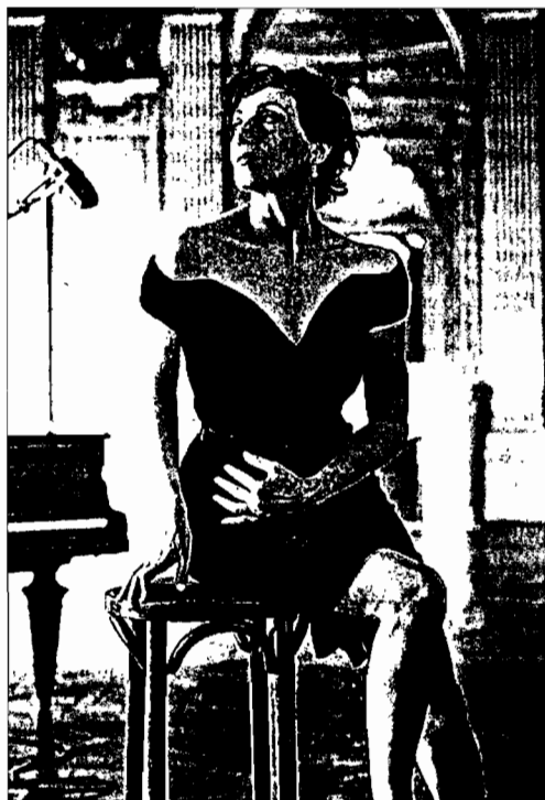
La gallega Luz Casal tiene una legión de admiradores en Francia

Por lo demás, Luz prosigue con su gira de conciertos, aunque aquí, en su tierra natal, no la podremos ver actuar hasta finales del mes que viene. En principio, el veintiocho, viernes, estará en Pontevedra y al día siguiente en Lugo.