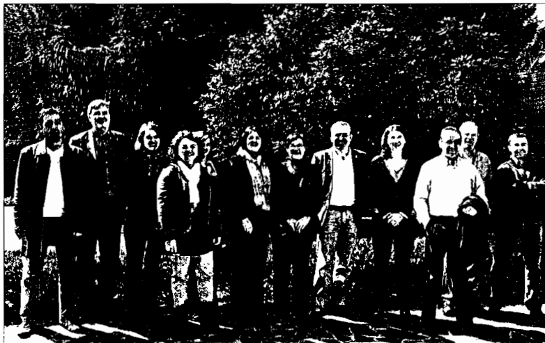
Los representantes de las ciudades que participan en el programa tras la reunión de ayer en Santiago