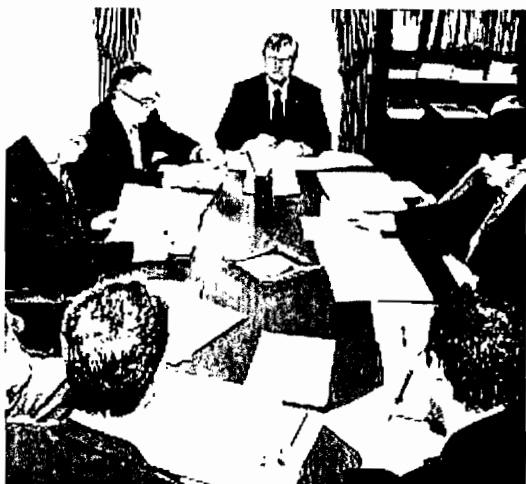
Imaxe dos asistentes ao acto en Fonseca