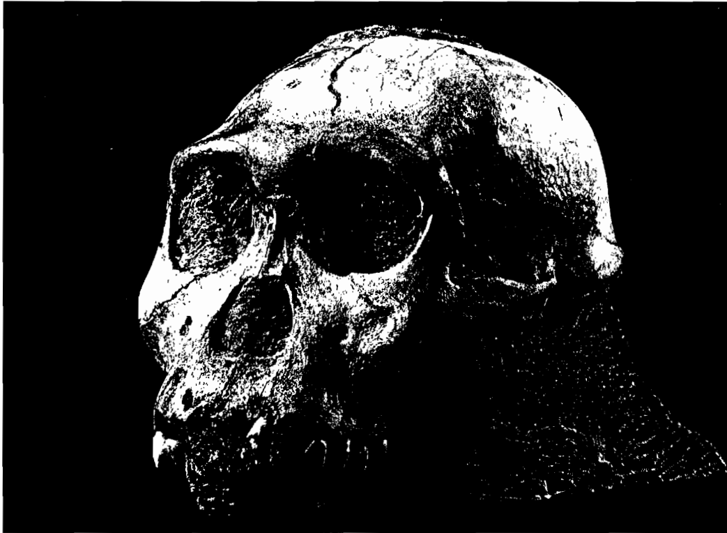
Cranio da nova especie de homínido, denominada Australopithecus Sediba

Os dous esqueletos estudados amosan un cerebro moi pequeno e uns brazos moi longos