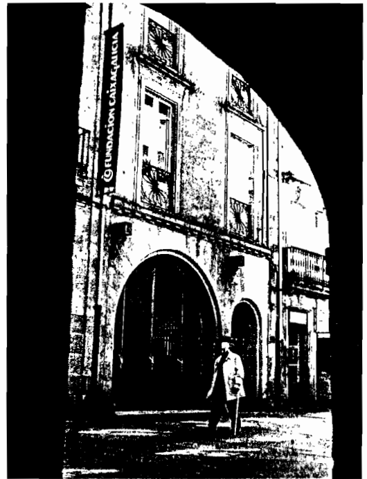
La Fundación Araganey lindará con la Fundación Caixa Galicia

La Fundación Araganey-Puente de Culturas celebró el año pasado sus 25 años, toda una trayectoria en la que ha venido trabajando para «promover