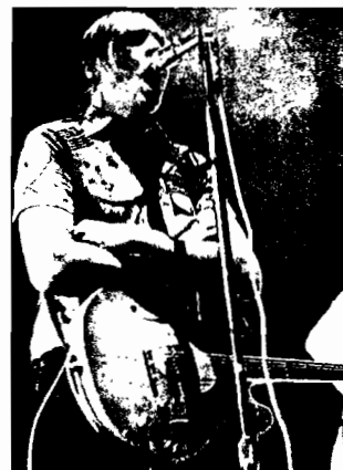
ABARROTADO Quince mil personas llenaron el Monte do Gozo para disfrutar, en especial, de los Arcade Fire (arriba)