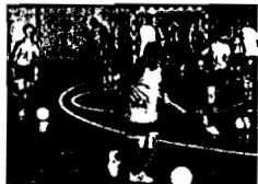
El campus tendrá lugar entre el 1 y el 9 de septiembre.

La Consellería de Medio Rural presenta una norma por la que se modifica la dotación presupuestaria consignada para la concesión de ayudas a la gestión sostenible de las explotaciones. El nuevo contrato de Explotación sostenible (CES), que va de 2007 a 2013, comprende las ayudas agroambientales y las destinadas al bienestar de los animales, para mejorar el medio y el entorno.