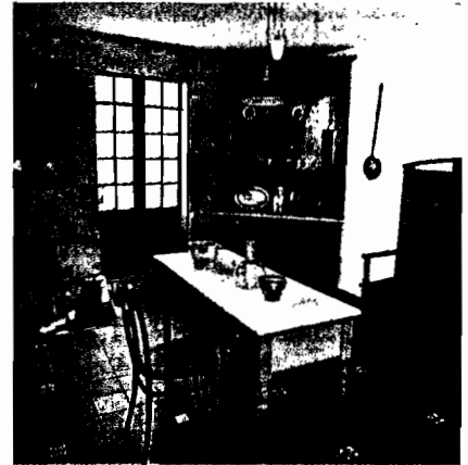
El museo de la Casa da Troia, ahora en obras.