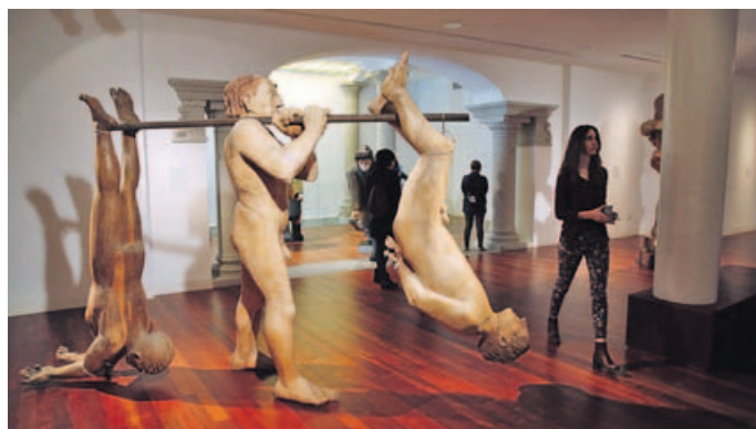
La exposición de Leiro, en el Centro Abanca, podrá visitarse hasta junio. ALVARO BALLESTEROS