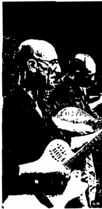
Berroguetto en concierto

AUDITORIO Por primera vez en su trayectoria, el prestigioso grupo folk Berroguetto editará un DVD con una de sus actuaciones. Se trata del concierto que ofrecerá en Santiago el próximo sábado, que tendrá lugar a partir de las nueve de la noche en el Auditorio de Galicia. Con este concierto el grupo cierra su gira Kosmogonías. El DVD, que incluye dos canciones de la banda sonora de la película The Way , saldrá en 2011. eco