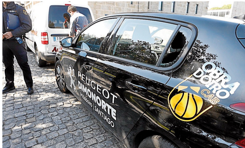
El coche de un jugador del Obradoiro, con la ventanilla rota, ayer, en sede policial.

Los coches fueron asaltados la noche del pasado sábado, entre ellos, el de un jugador del Obradoiro