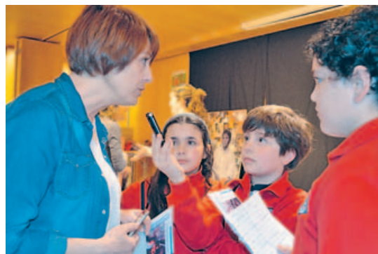
Los alumnos tomaron contacto con todos los géneros periodísticos.

Más de treinta estudiantes de los colegios Juventud y Vilas Alborada de Santiago participan en los talleres de radio para la educación en valores que promueve la oenegé Asamblea de Cooperación pola Paz. Se trata de una de las actividades para el desarrollo encuadradas en el movimiento europeo «Escolas sen racismo», que engloba a más de 500 centros educativos. La actividad tendrá una duración de seis jornadas.