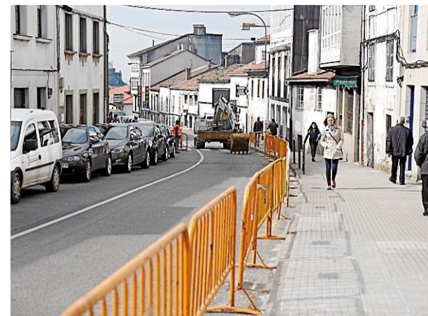
Vallas en la parte más próxima a San Roque.

Estas obras, que abarcan el tramo entre Santa Clara y Basquiños, cuentan con un presupuesto de 340.310 euros, y el plazo de ejecu-