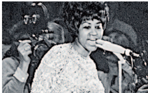
El concierto de Aretha Franklin en Ámsterdam cerrará la jornada.

tro, a las 22.30, habrá otra película premiada de la temporada, 45 años , con la que sus protagonistas, Charlotte Rampling y Tom Courtenay, obtuvieron dos Osos de Plata en Berlín.