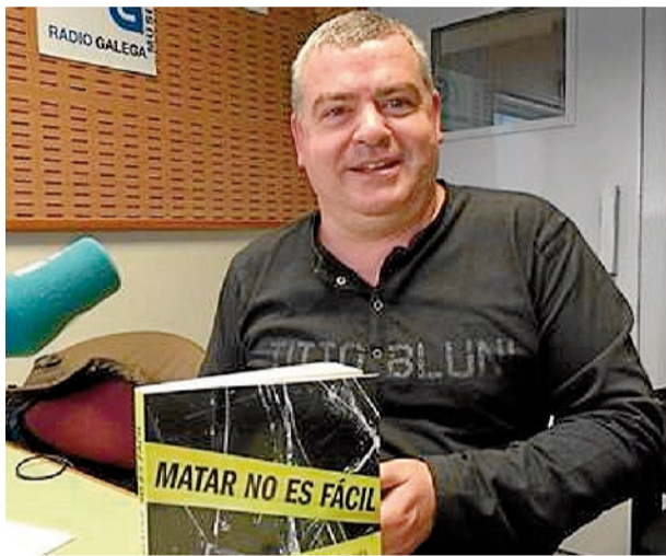
El juez Taín presentó ayer su novela 'Matar no es fácil'

En una entrevista concedida ayer a la Radio Galega y recogida por Europa Press, Taín no pudo hacer como Umbral y exigir hablar solo de su libro, el reciente veredicto sobre el caso Asunta fue una de las primeras cuestiones sobre las que se le preguntó.