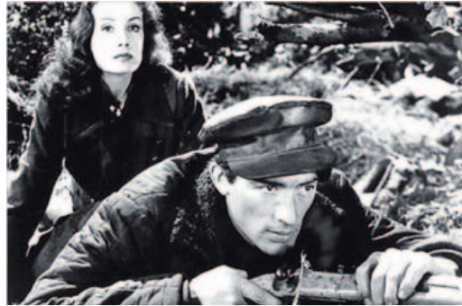
«Días de gloria» abrirá las proyecciones de Cineuropa esta tarde.

Entre las citas destacadas del día está también Le Nouveau , la comedia de Rosenberg elegida como la proyección inaugural de esta edición. El trabajo, premio Nuevos Realizadores del festival de San Sebastián, ilustra la etapa de la preadolescencia desde una mirada «tremendamente subversiva», tal y como la describió el director de Cineuropa, quien calificó la comedia que se podrá ver en el Principal a las 20.30 como «uno de los grandes descubrimientos del año». En el mismo teatro,