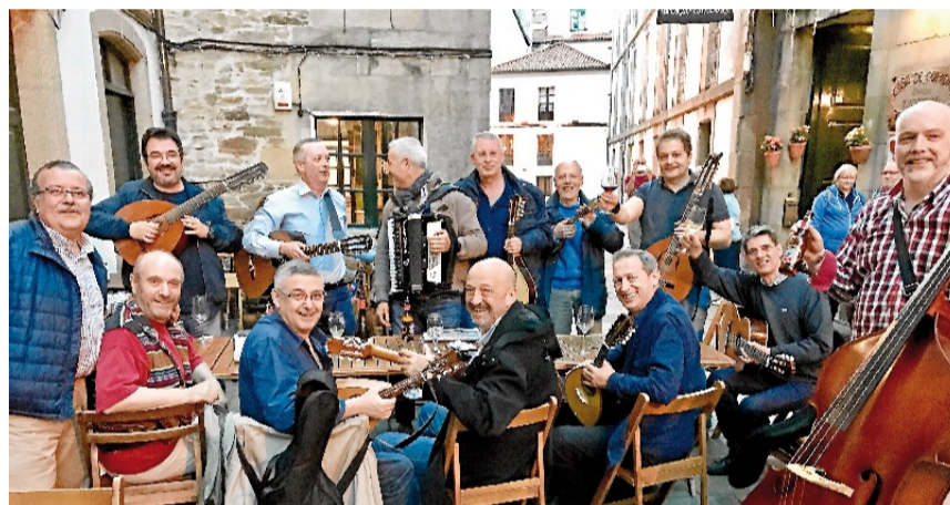
LA MÚSICA sale a las calles de Santiago gracias al buen hacer de los 'trojanos'