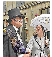
Paseo del pasado viernes

Santiago. La Casa de la Troya organiza hoy una nueva ruta cultural teatralizada por el casco histórico de Compostela. El paseo se encuadra en el marco de la iniciativa Venres Troyanos que, cada semana, lleva a cabo actividades de este tipo. El recorrido empezará a las 20.30 horas desde la praza do Toural y finalizará a las 22.00 horas delante del museo. La inscripción puede hacerse contactando con el 981 585 159.