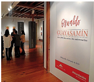
Exposición de Guayasamín en Afundación