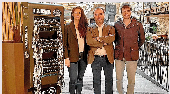
Los responsables de la 'Chargy Station', junto al gerente de La Galiciana.

Santiago. El mercado gastronómico La Galiciana estrenó el martes una Chargy Station , un espacio de carga de móviles que cuenta con la tecnología más puntera del sector. Se trata de unos dispositivos de carga inteligentes que proporcionan una experiencia innovadora al usuario. La nueva estación de carga cuenta con capacidad para 300 ipowerbanks y está ubicada en la entrada del local, junto al food truck donde se debe solicitar su uso.