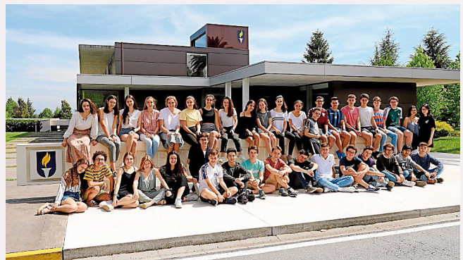
Grupo de alumnos de 2º de Bachillerato, que este año dejará el centro

Santiago. El Colexio M. Peleteiro cosecha estos días un nuevo éxito. El centro destaca que la promoción de 2º de Bachillerato deja este año el instituto con un nivel muy elevado de inglés. De los 99 alumnos que terminan este año sus estudios, casi la mitad de ellos cuentan con un nivel de inglés de C1 o C2, acreditados por la Universidad de Cambridge. Se trata de los niveles más altos a los que se puede optar en esta disciplina, además de ser reconocidos mundialmente.