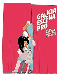
Cartel de la iniciativa

Santiago. Más de 150 agentes culturales se reunirán los días 13 y 14 de junio en Compostela con motivo de la séptima edición de Galicia Escena Pro. La iniciativa busca servir de escaparate para las artes escénicas gallegas, reuniendo a artistas y productores de todo el país para facilitar la contratación de las compañías locales. Este año, como es habitual, el programa se abrirá con espectáculos dirigidos al público general.