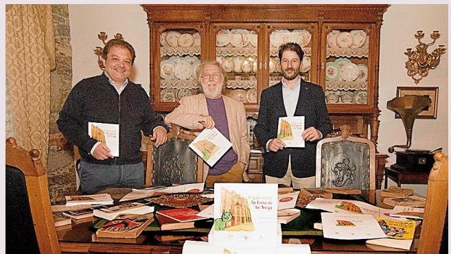
Los responsables posan durante la presentación del proyecto

Santiago. La Casa de la Troya pone en marcha un nuevo proyecto que busca alcanzar a cerca de 3.000 escolares de 5º y 6º de Primaria. Se trata de la iniciativa La Casa de la Troya nas escolas de Santiago de Compostela , que arranca con la publicación, junto a Auga Editora, del cuento infantil O gato verde de La Casa de la Troya . Se espera que el cuento sea entregado a lo largo de esta semana al alumnado de los centros de Teo, Oroso y Ames.