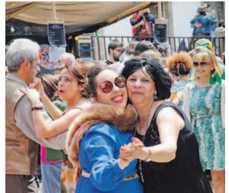
Música, baile y juegos ayudarán en el viaje al pasado. P. R.

populares (16.00 a 20.00 horas), un espectáculo musical para los más pequeños (17.00 horas) y el concierto de la Banda Municipal de Música con el grupo Odaiko. Por la noche llegan los bailes de Cuba con Marcos Pombo, Sergio y el grupo Son3 (21.00 horas) para concluir con pop-rock de los 60, 70 y 80 con Los Mecánicos (22.30 horas).