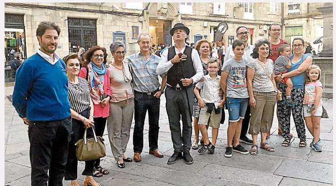
Última ruta teatralizada de La Casa de la Troya, con los miembros de Raigame

Santiago. La Casa de la Troya cierra hasta Semana Santa, habiendo recibido cerca de 2.500 visitantes este año. El pasado viernes tenía lugar la última ruta teatralizada de esta temporada, que estuvo dirigida de manera especial a la Asociación de Veciños do Ensanche, Raigame. Pese al parón, el museo continuará con la iniciativa La Casa de la Troya nas escolas de Santiago de Compostela , con la que pretenden dar a conocer la historia del local a los escolares.