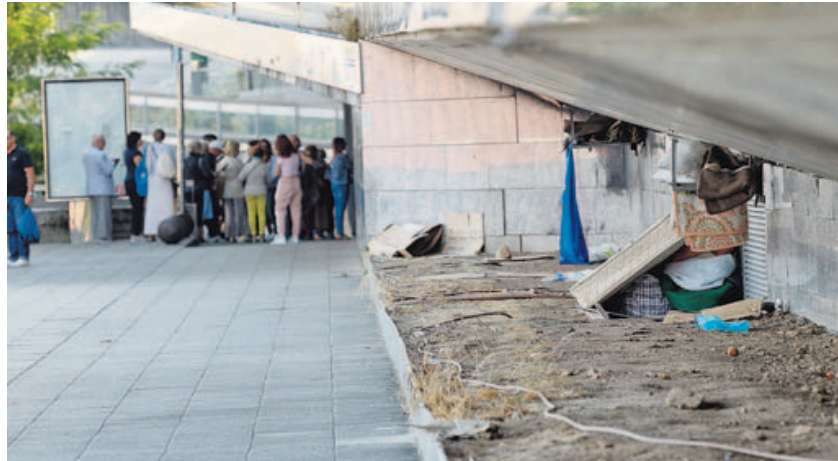
Esta zona de Xoán XXIII se acondicionó como jardín para evitar su ocupación nocturna. SANDRA ALONSO

La convocatoria está destinada a actividades que se desarrollen desde el 1 de septiembre del 2019 hasta el 30 de noviembre del 2020. El plazo de presentación de solicitudes es de un mes y empieza a contar hoy mismo.