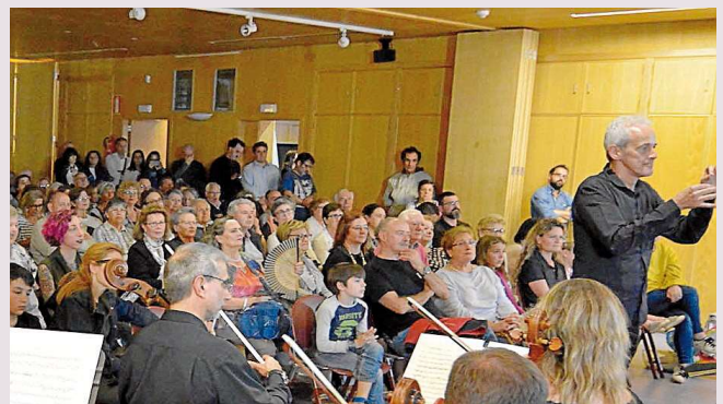
La Real Filharmonía actuando en Fontiñas, durante una edición pasada del ciclo

Santiago. Siguiendo con su objetivo de llevar la música clásica a toda la ciudadanía, la Real Filharmonía de Galicia empieza esta semana un ciclo de conciertos gratuitos en algunos barrios de la ciudad bajo la batuta de su director, el maestro Paul Daniel. El primer recital tendrá lugar mañana en el centro sociocultural de Fontiñas. Le seguirán el centro sociocultural de Vite, el jueves, y la iglesia de Santa María de Conxo, el viernes. Las citas están programadas para las 19.00 horas.